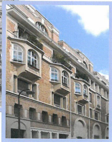
Rue Albéric Magnard, Paris XVI