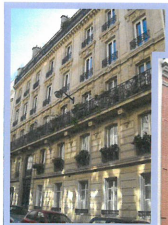
Rue de la Bienfaisance, Paris VIII