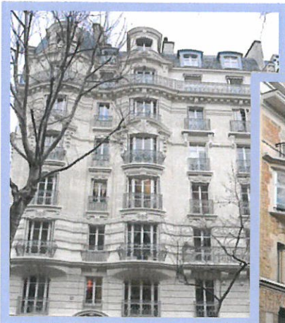
Avenue Ledru Rollin, Paris XII